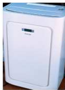
スポットクーラー